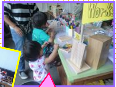
木製ハガキ コーナー